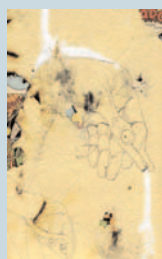
Alvise Bittente, Mr. Acne The Bing Bang..., 2007. Disegni a china, collage, 34,5 x 24,5 cm.

La mostra dedicata dalla Galleria In Arco all'artista Massimo Kaufmann celebra il ritorno alla pittura e all'uso del linguaggio della trasparenza. I