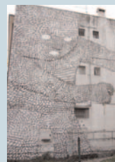
Blu, Senza Titolo, 2007. Muro dipinto a Verona, 12 x 8 m.

Si intitola "Walls Around" la mostra presentata da Blu (1981) alla Galleria Artericambi. L'artista, che si ispira al graffitismo di fine anni Settanta e alla Street Art, rinnova l'incontro tra