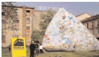
Progetto di Tomas Saraceno per la mostra SituazioniIsola, aprile 2007.

BH-N: Sì, quasi tutti i nostri progetti hanno una base performativa. È come quando vai al cinema, è l'azione il punto focale. In "56 x 45 x 25 cm" non rimaneva il ricordo del film, ma un "sottoprodotto" che è il prodotto. L'aspetto performativo del laboratorio di Nina Mrsnik era la produzione di mobili in legno; il lavoro di Tom Price per trasformare una palla di corda in una sedia poneva l'attenzione sul processo di produzione dell'oggetto. Io ho ideato una sedia che, se non usata, sta in equilibrio oscillando, performando letteralmente! Il mio progetto si basava sull'idea di performance intrinseca all'oggetto, mettendo in questione l'interazione che abbiamo con gli oggetti per creare attorno ad essi una narrazione. Guardando un parcheggio pieno di macchine, l'occhio e la mente non discriminano le forme e i colori; ma appena ne vedi una che ha lasciato le luci accese, all'improvviso si crea un'intera storia, ti chiedi, c'è qualcuno dentro? Hanno dimenticato le luci accese?, ecc. In questo senso, la mia sedia non si rivolge solo a chi deve utilizzarla ma anche a chi la osserva. —IB